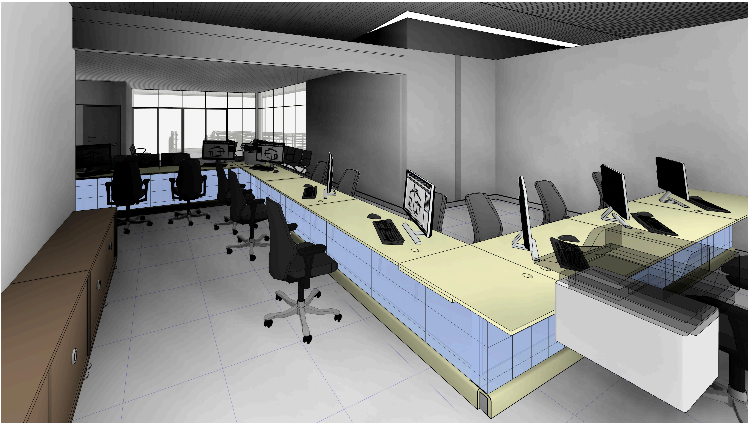
4 PERSPECTIVA 4 escala