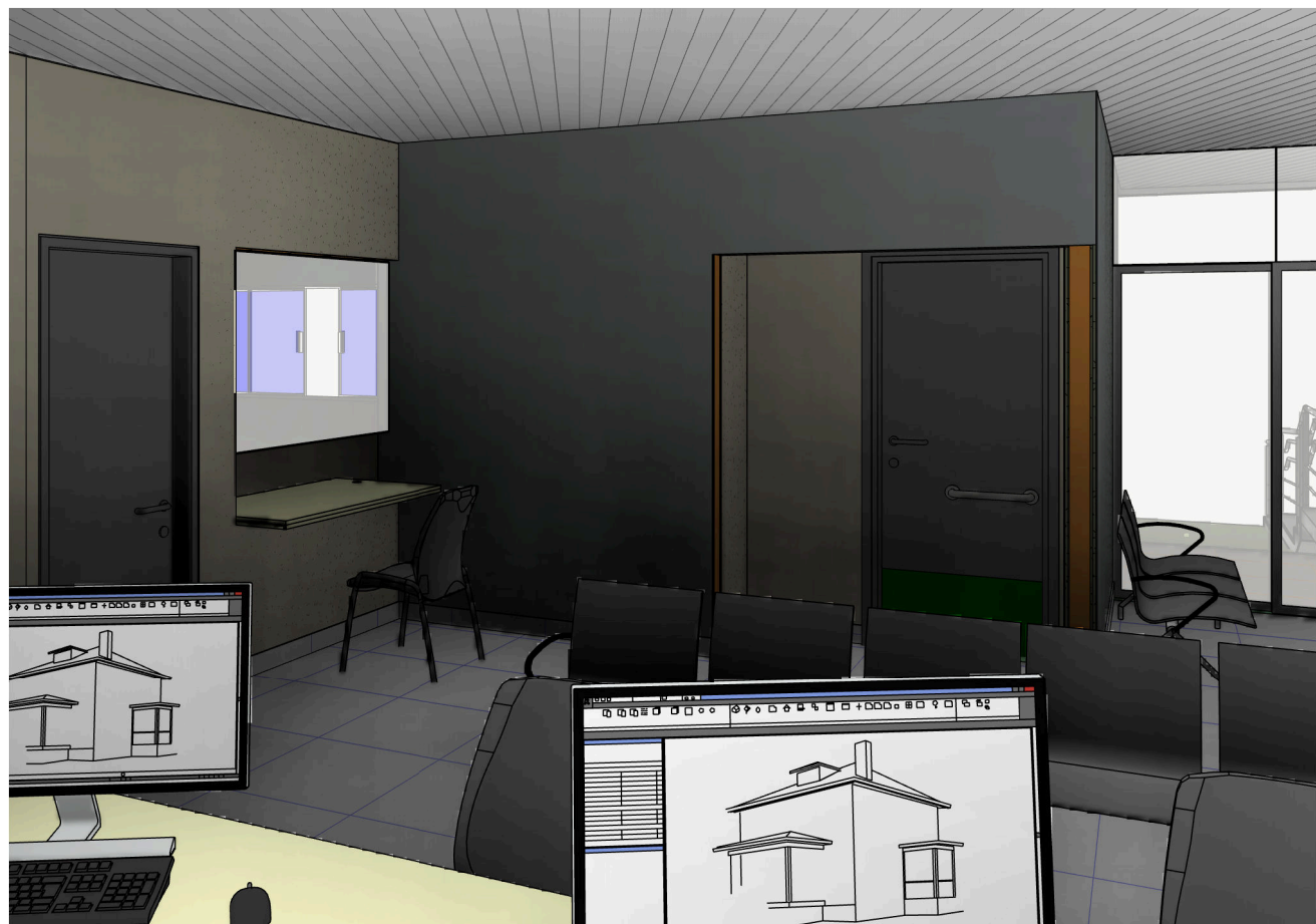
7 PERSPECTIVA 7 escala