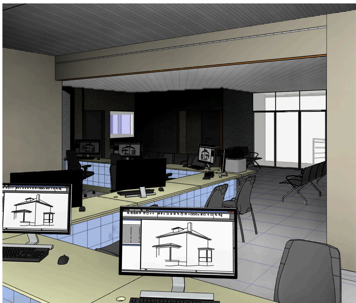
2 PERSPECTIVA 2 escala