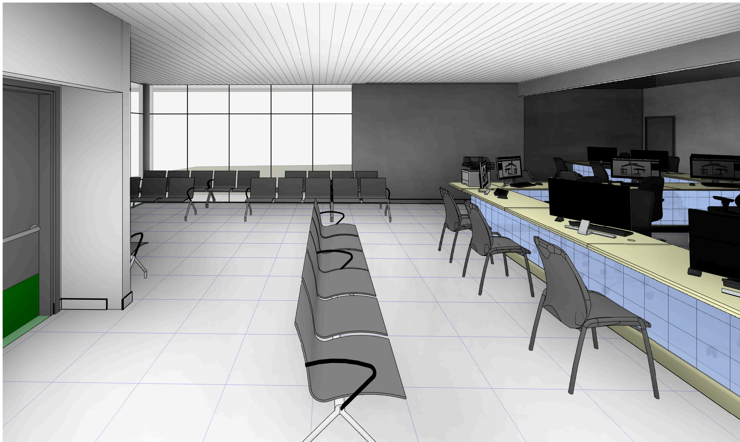
5 PERSPECTIVA 5 escala